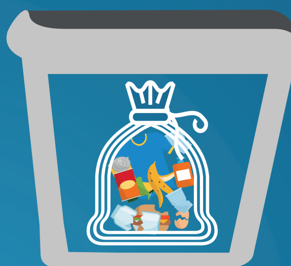
SECCO RESIDUO (INDIFFERENZIATO)

I FAZZOLETTI, LA CARTA ASSORBENTE DA CUCINA, LE MASCHERINE, I GUANTI E I TELI MONOUSO DEVONO ESSERE RACCOLTI NEL SACCHETTO UTILIZZATO PER I RIFIUTI INDIFFERENZIATI (RIFIUTO SECCO RESIDUO).